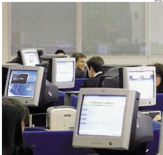
► Terminali in un ufficio pubblico

IL SERVIZIO è della Bbc, datato 2007, ma al Comune di Napoli, con l'inglese non c'è molto feeling. Quindi solo "pochi eletti" sanno che è quanto meno "sconveniente" riportare al vecchio fornitore i computer da rottamare, dormendo sonni tranquilli. E i dati contenuti nel picci? Fin quando sono quelli personali... ma al Comune i terminali sono negli uffici più delicati: dall'Anagrafe alle concessioni edilizie, fino a Gare e contratti. Per non parlare poi